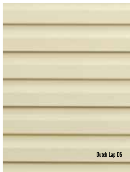
Dutch Lap D5